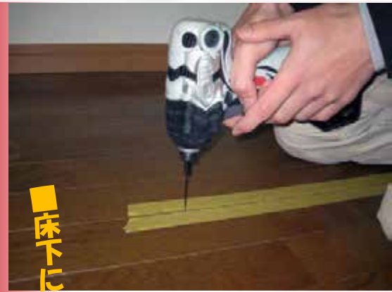
■床下に注入する方法