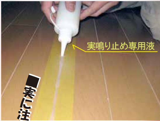
実鳴り止め専用液

あらゆる床鳴り・階段の鳴り・框とフローリングの擦れによる鳴り（床暖房の床鳴りもご相談ください。）